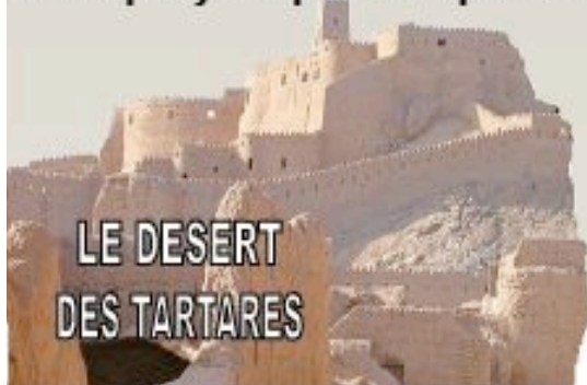
LE DESERT DES TARTARES

Quinze d'entre elles constituent le spectacle éponyme que nous présentons.